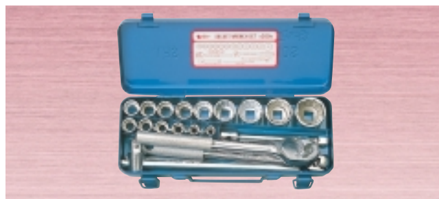
N 260M ・ソケット 15サイズ 20点セット