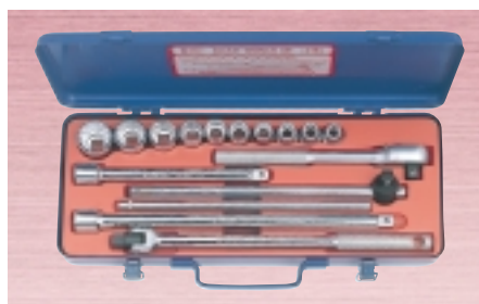
N 316M・316J ・ソケット 10サイズ 15点セット