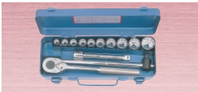
N 800M・880M ・ソケット 10サイズ 13点セット