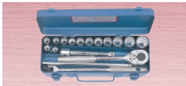
N 750M ・ソケット 13サイズ 17点セット