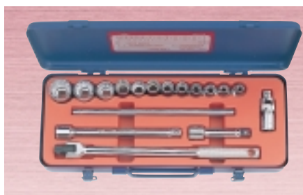
N 317M ・ソケット 12サイズ 17点セット