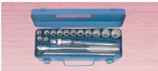
N 1750M ・ソケット 13サイズ 17点セット